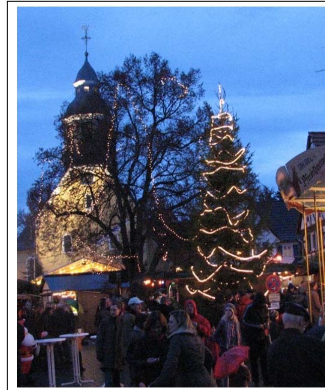
Der Weihnachtsmarkt in Alt-Haßloch -

Eine Publikation des Seniorenbeirats der Stadt Rüsselsheim